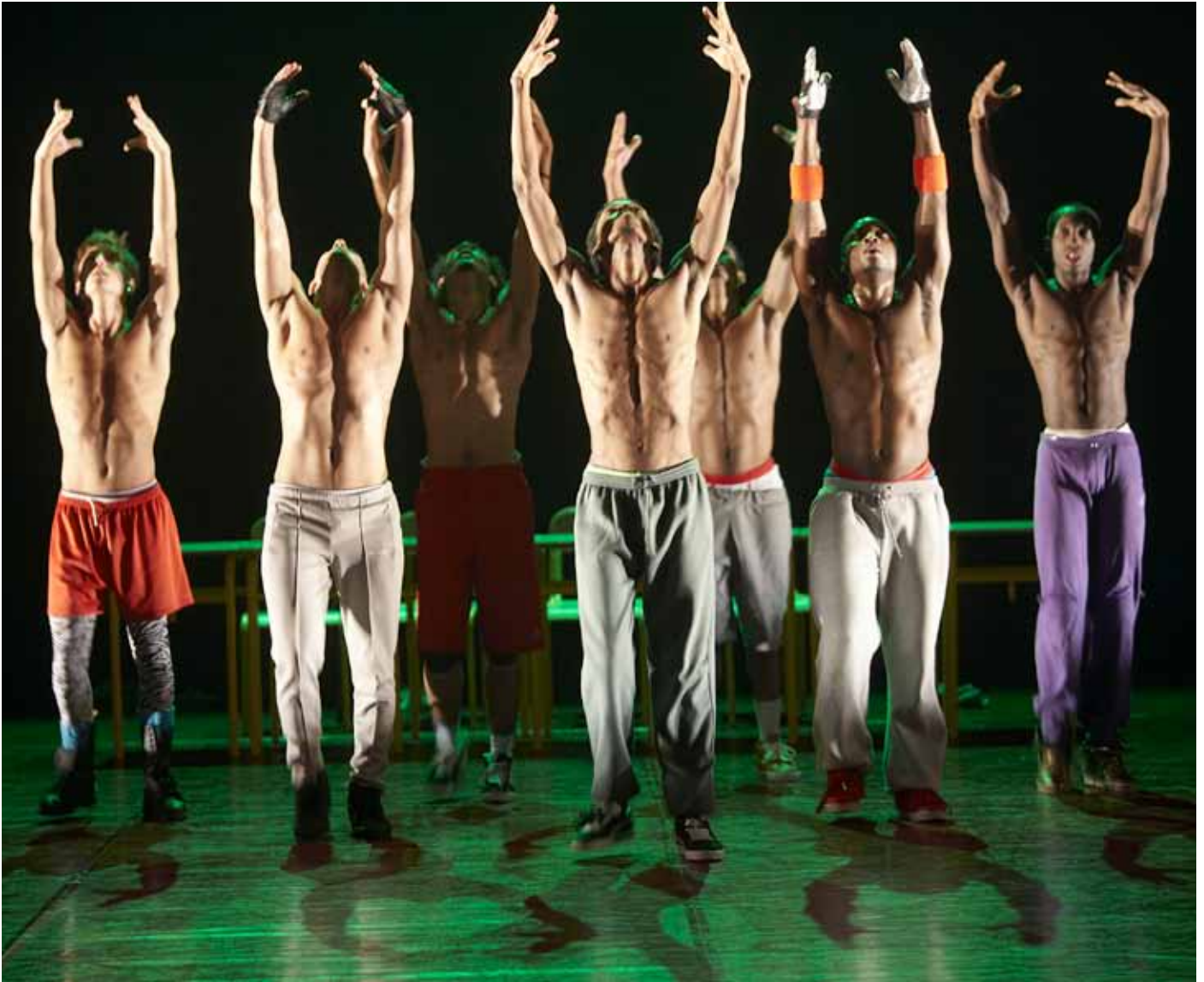
Elektro Kif, 2010

Blanca aime s'entourer de personnalités aux qualités artistiques avérées mais surtout humaines. Car la joie et la bonne humeur font partie intégrante de son mode de travail ! Toute une tribu de professionnels, dont l'expertise et la créativité sont garants de la beauté formelle et symbolique des spectacles, ont ainsi tissé des liens d'appartenance et de fidélité à Blanca depuis ses débuts.