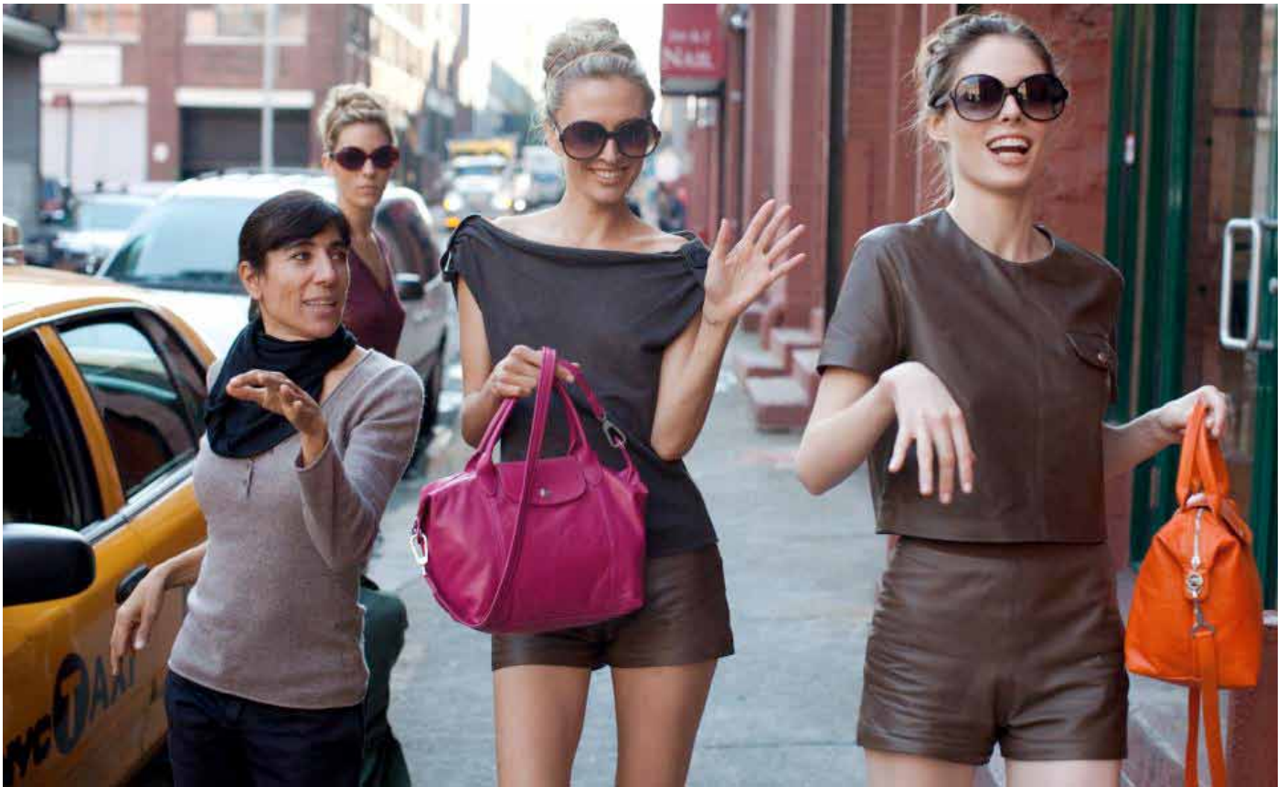
Making of de Oh my bag, pour Longchamp