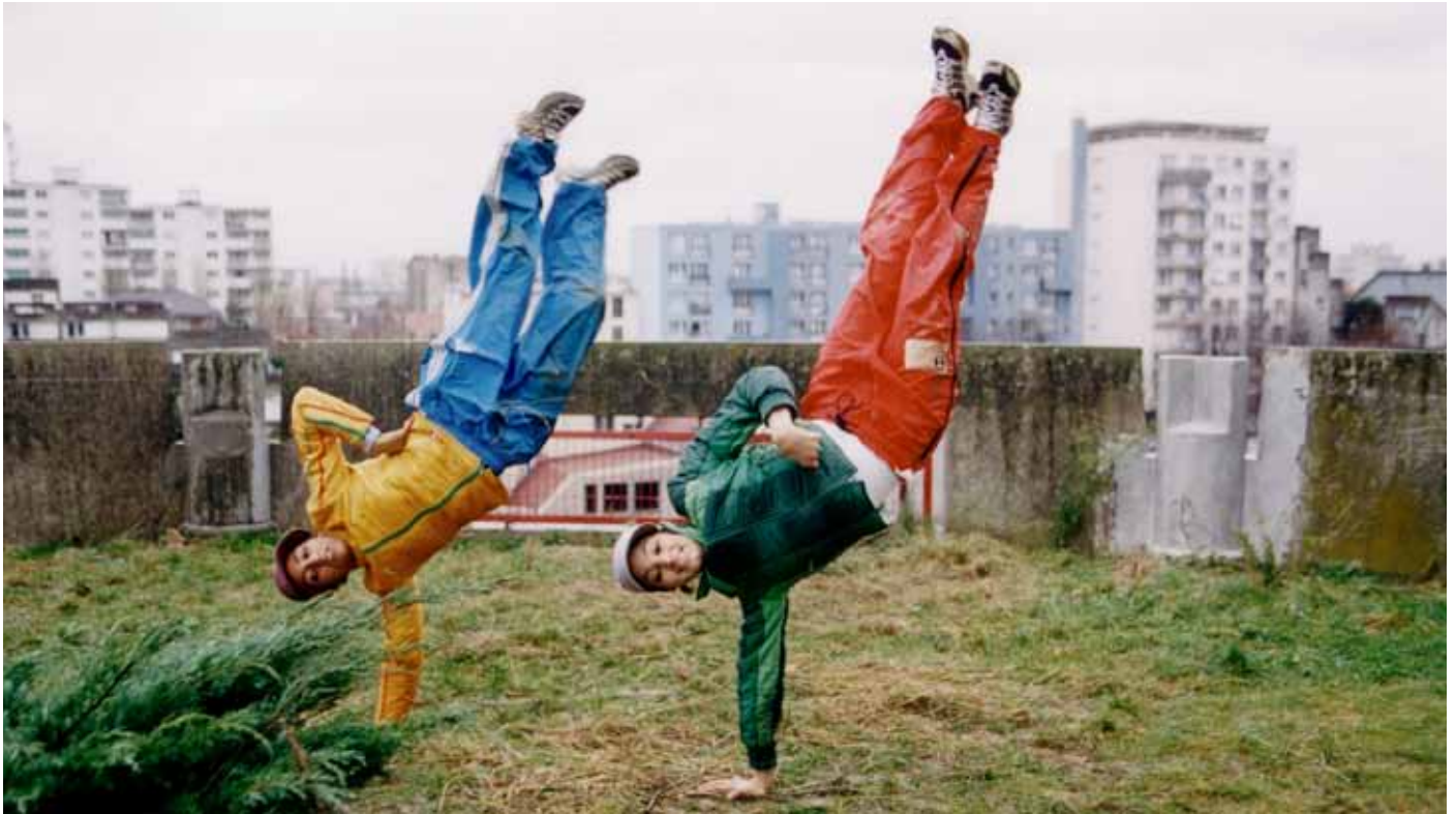
Le Défi (2001)

Blanca aime tout du cinéma, qu'elle soit devant ( Pigalle de Karim Dridi, 1992 ; Kika de Pedro Almodovar, 1993 ; ou Le Code a changé de Danielle Thompson, 2009) ou derrière la caméra, voire à côté, comme quand elle assure la création chorégraphique de longs métrages de fiction, de Gazon maudit ou Nettoyage à sec (1997) à L'Écume des jours de Michel Gondry, en passant par le dernier film de Pedro Almodóvar, Los Amantes Pasajeros , prochainement à l'affiche (2013).