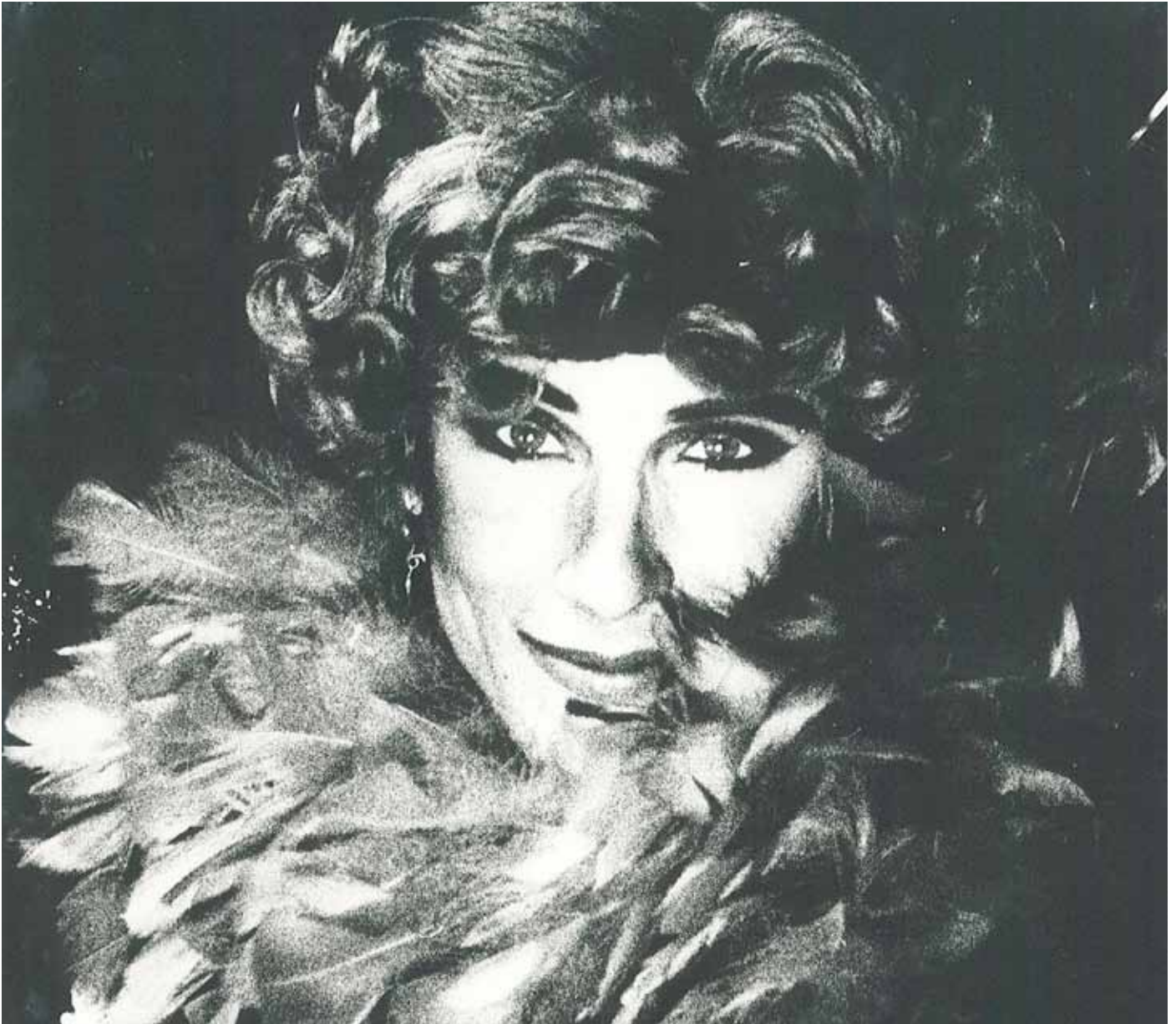
Blanca Li, numéro Zaragoza dans son cabaret Calentito à Madrid (1989)

Blanca Li est née à Grenade en Espagne, creuset historique et actuel de la culture arabo-andalouse, à la source de son inspiration. Enfant, elle voulait déjà danser mais lors d'une audition dans un cours de GRS, elle est propulsée dès 12 ans dans l'équipe nationale espagnole de gymnastique rythmique.