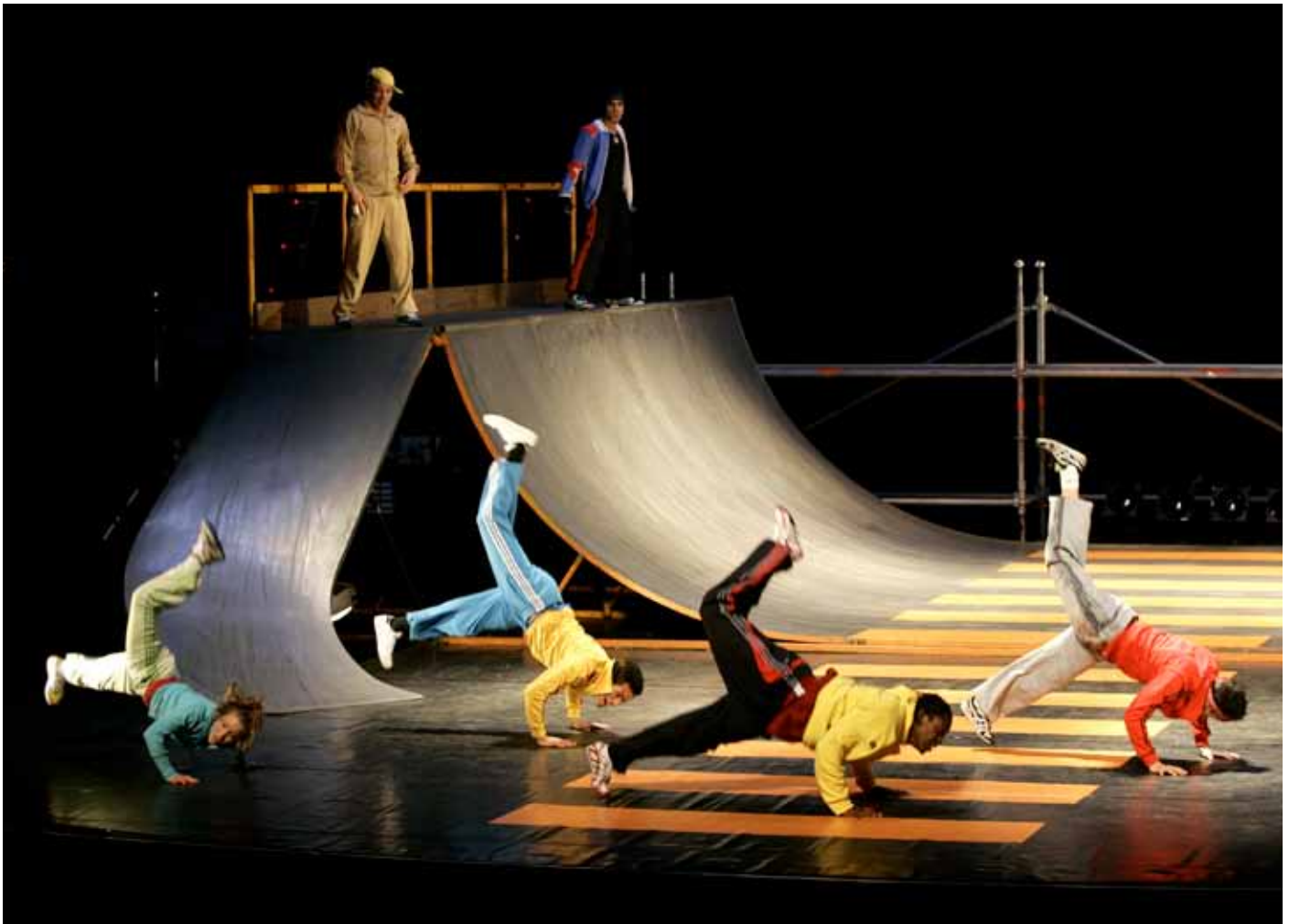
Macadam Macadam