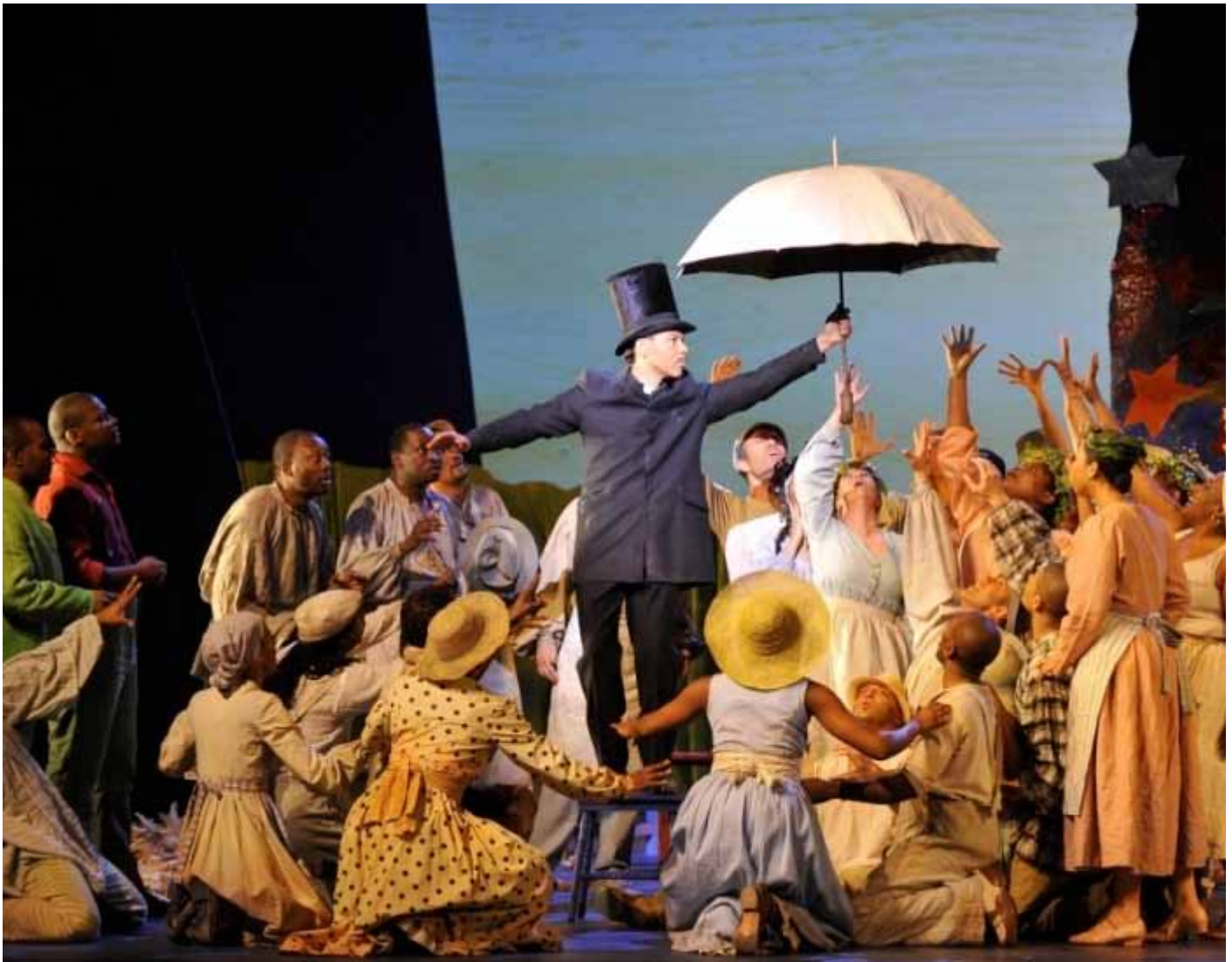
Treemonisha au Théâtre du Chatelet (2010)

A partir d'un large éventail de formes d'expression corporelle, du flamenco au hip-hop en passant par la danse classique, contemporaine ou baroque, Blanca Li signe également un parcours personnel en dehors de sa compagnie, de l'opéra à la comédie musicale en passant par le ballet.