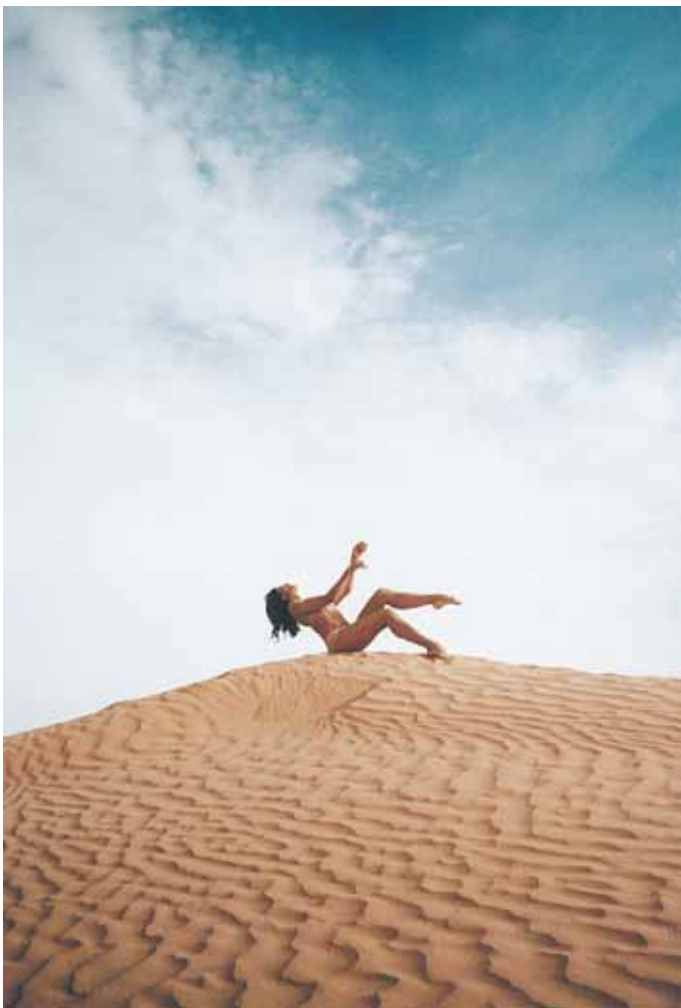
Sandance de Blanca Li pour Shiseido

Dans ses chorégraphies comme dans sa vie, Blanca sait conjuguer le glamour au populaire, l'énergie festive et l'attention à l'autre, l'esthétique pop ou latino-chic au classicisme des lignes du mouvements. Des qualités qui ne pouvaient laisser insensibles les mondes connexes de la musique, de la haute-couture et de la mode.