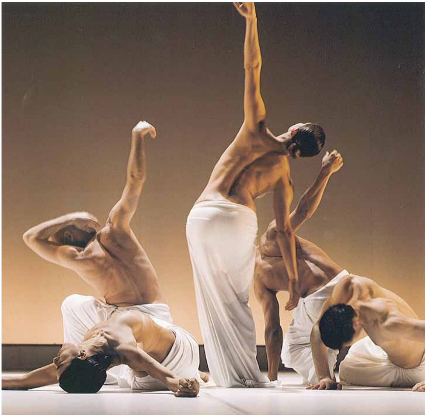
Le Songe du Minotaure © Jean-Nicolas Salvatori

Ancrée à Paris, où elle installe ses propres studios dès 1998, Blanca est toujours prête à traverser les frontières symboliques et géographiques, comme elle aime à dépasser les barrières disciplinaires.